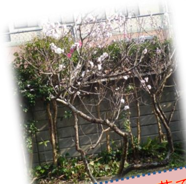
ハウス近くの梅の花です

澄み渡る五月晴れのさわやかな 日が続いたかと思えば、風の強 い日もあり、服装選びが難しく 体調管理には気をつけたい 今日この頃です。